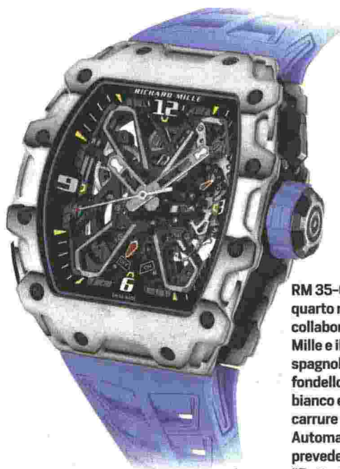
RM 35-03 "Rafael Nadal", quarto modello relativo alla collaborazione tra Richard Mille e il fuoriclasse spagnolo. Lunetta e fondello in Quartz TPT bianco e Carbon TPT, e carrure in Carbon TPT. Automatico di manifattura, prevede un rotore "Butterfly", regolabile con pulsante al 7