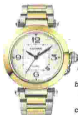
Pasha de Cartier, acciaio e oro giallo, 41 mm, vetro zaffiro, corona con cabochon in spinello sintetico blu. Quadr. argenté, guilloché soleil, minuteria a chemin de fer, Automatico manifatt., calibro 1847 MC, 40 ore di autonomia. Prezzo: 11.500 euro