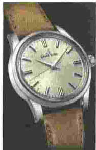
Grand Seiko Elegance acciaio, 38,5 mm, vetro zaffiro antiriflesso, fondo trasparente a vite. Imp.: 30 metri. Quadrante argenté spazzolato a motivo "washi", sfere Dauphine. Calibro manuale di manifatt. 9S64, autonomia di 72 ore. Prezzo: 4.800 euro