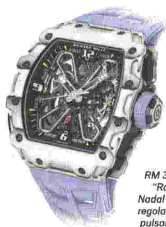
RM 35-03 "Rafael Nadal"; rotore regolabile con pulsante al 7

razione con Richard Mille, giunta alla sua quarta evoluzione, con il RM 35-03 Automatico Rafael Nadal. L'orologio ha richiesto tre anni di sviluppo, specificamente riservati alla messa a punto del nuovo rotore a farfalla, regolato in base allo stile di vita e al livello di attività dell'utilizzatore: un sistema già adottato dalla Maison, ma ottimizzato, in quanto è chi indossa l'orologio a poter intervenire personalmente sulla modalità di ricarica dello stesso. In tal senso, il suddetto rotore è costituito da due bracci in titanio grado 5, con applicati dei segmenti periferici in metallo pesante: nella loro posizione iniziale affiancati, i bracci concentrano la loro massa in un'unica posizione esterna (modalità normale), convertendo ogni movimento del polso in rotazione utile alla ricarica. Premendo il pulsante al 7, i bracci si dispongono simmetricamente a 180°, bilanciando il rotore e rendendolo molto poco sensibile ai movimenti del polso (modalità "sport"). Un indicatore di carica, al 6, sul quadrante a vista, segnala se il rotore di carica è attivo (ON) o meno (OFF). Interamente scheletrato, il movimento è visibile da entrambi i fronti della cassa. L'RM 35-03, da 43,15 x 49,95 x 13,15 mm, lo vediamo illustrato con lunetta e fondello in Quartz TPT bianco e Carbon TPT, e carure in Carbon TPT.