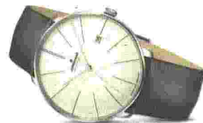
Junghans Meister fein Automatic, acciaio, 39,5 mm, vetro zaffiro antiriflesso, fondo a vista. Impermeabilità: 50 metri. Quadrante argenté, finitura opaca, indici a filo, lancette a bastone, datario al 3. Automatico, calibro JB00.1. Prezzo: 1.190 euro