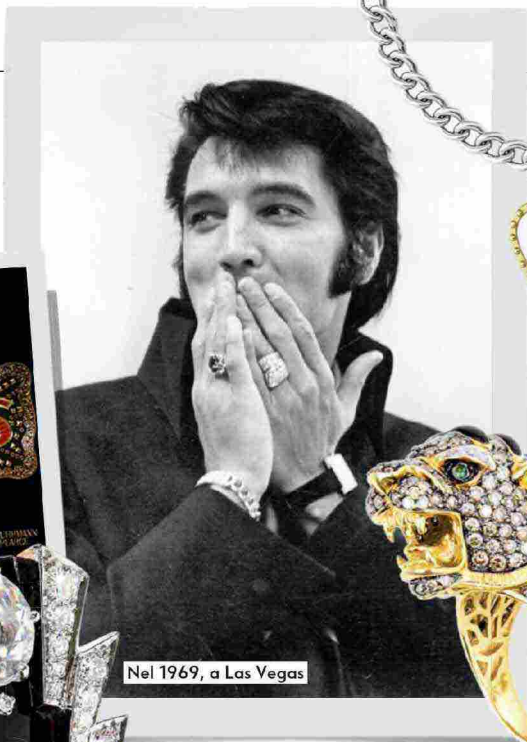
Nel 1969, a Las Vegas